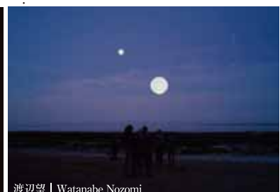
渡辺望 | Watanabe Nozomi