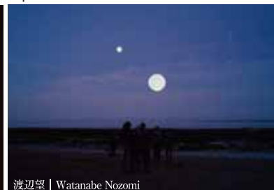
渡辺望 | Watanabe Nozomi